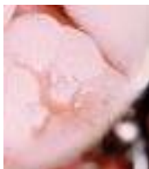
Billede af tand med lak

Men: Husk det er stadig vigtigt at børste grundig på tænderne for at undgå huller!